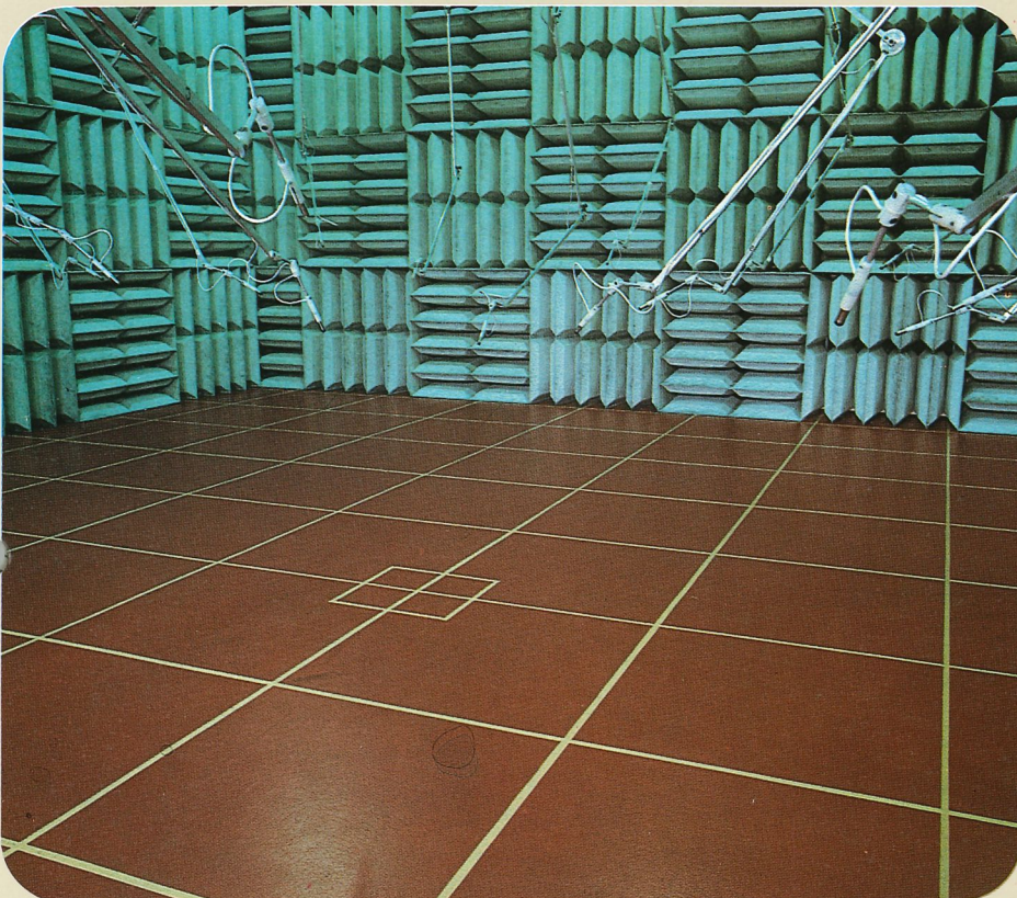
Laboratori di acustica SCM - Camera semianecoica SCM noise abatement laboratory - Semianechoic room Laboratoire d'acoustique SCM - Chambre semi-anéchoïque SCM Lärmforschungslabor - Schallmessraum - Teilweise schalltot