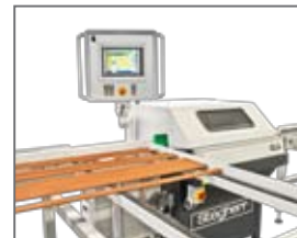
Profilleistensäge GLS: Sägewinkelverstellung bis +/- 81 Grad