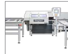
Profilleistensäge GLS-2: Sägewinkelverstellung in zwei Ebenen