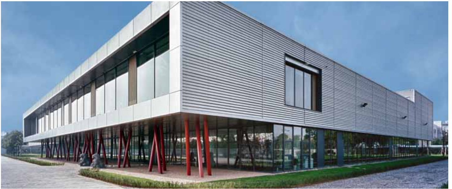
Das Werk in Changzhou, China.

Die internationale Ausrichtung verbunden mit dem kontinuierlichen Streben nach Innovationen begründen den weltweiten Erfolg von Wemhöner Surface Technologies. Um auch im wichtigsten Markt der Zukunft die Spitzenposition bei der Herstellung von Maschinen und Anlagen für die Möbelproduktion zu besetzen, wurde 2006 die Wemhöner (Changzhou) Machinery Manufacturing in Changzhou, China, gegründet.