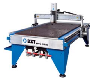
BZT PFA 2010 mit Vakuum-HD-Platte BZT PFA 2010 Vacuum HD plate