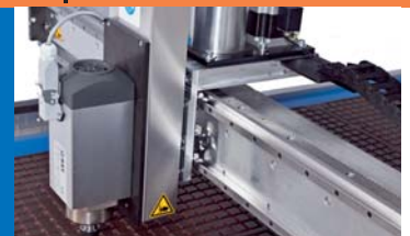
Z-Achse für HF-Spindeln bis 2,2 kW Z-Axes for HF-spindles up to 2,2 kW