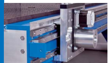
Linear-Rollenführungen, BZT PFA Linear roller guidings BZT PFA