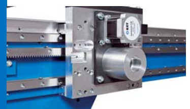
Hochpräzise schrägverzahnte Zahnstangen Angle-serrated rack, BZT PFA