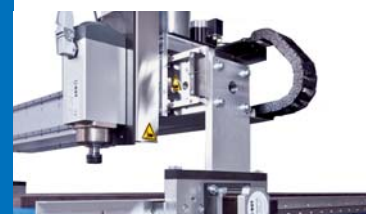
Schwingungsarme Z-Achse Low vibration Z-Axes