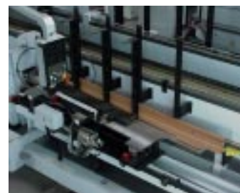
Magazin für Längs- und Querkanten