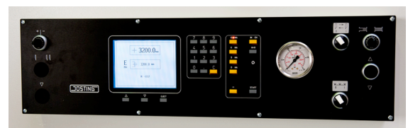
Bedienfeld der JOSTING MULTICUT

Die Multicut schneidet verschiedenste Materialien, wie PVC, Vollkunststoff, Polystyrol, Acryl, Wabenstrukturplatten, Papier, Pappe, Karton usw.