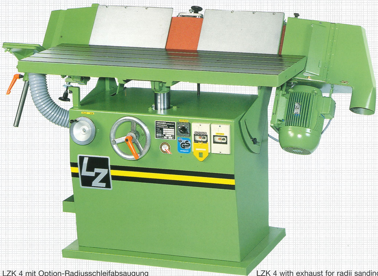
LZK 4 mit Option-Radiusschleifabsaugung

rationell, vielseitig und bedienungsfreundlich efficient, many-sided and easy to operate