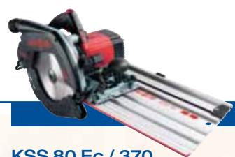
KSS 80 Ec / 370

Kompletmodel i kuffert Elektronik inkl. indstilling af omdrejningstal med parallelanslag, i MAFELL L-MAX kasse