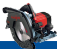
K 85 Ec

Startermodel med prisfordel Med elektronik, i papkasse