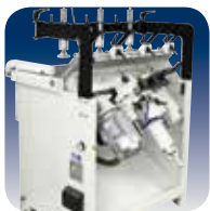
Bohrkopf Perfektes Bohren