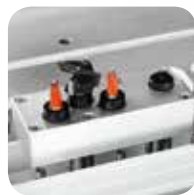
Aggregat für Topfbandbohrungen High-tech Zubehör

Einkopf- Mehrfachbohrmaschine mit 21 Spindeln für anspruchsvolle Tischlerei- und Handwerksbetriebe