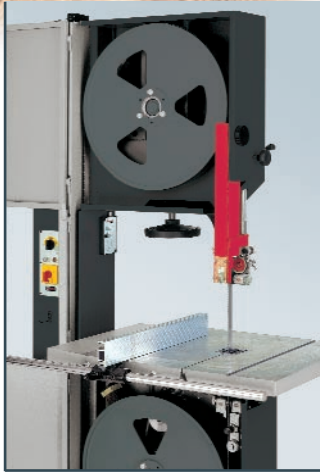
Weit zu öffnende Türen, schwenkbarer Tisch

Überall dort, wo diese Maschine nicht in der Produktion eingesetzt wird, also nicht unbedingt ein Höchstmaß an Leistung notwendig ist, bietet sich die HEMA-»Garant« als preiswerte Alternative zu den HEMA-Präzisionsbandsägen an. Trotz des enorm günstigen Preises ist die Maschine komplett ausgestattet mit oberer und unterer Spezialrollenführung, mit mechanischer Höhenverstellung der Führungsstange, schwenkbarem Tisch, vulkanisierten Bandsägerädern, Motorschutzschalter und Absaugstutzen.