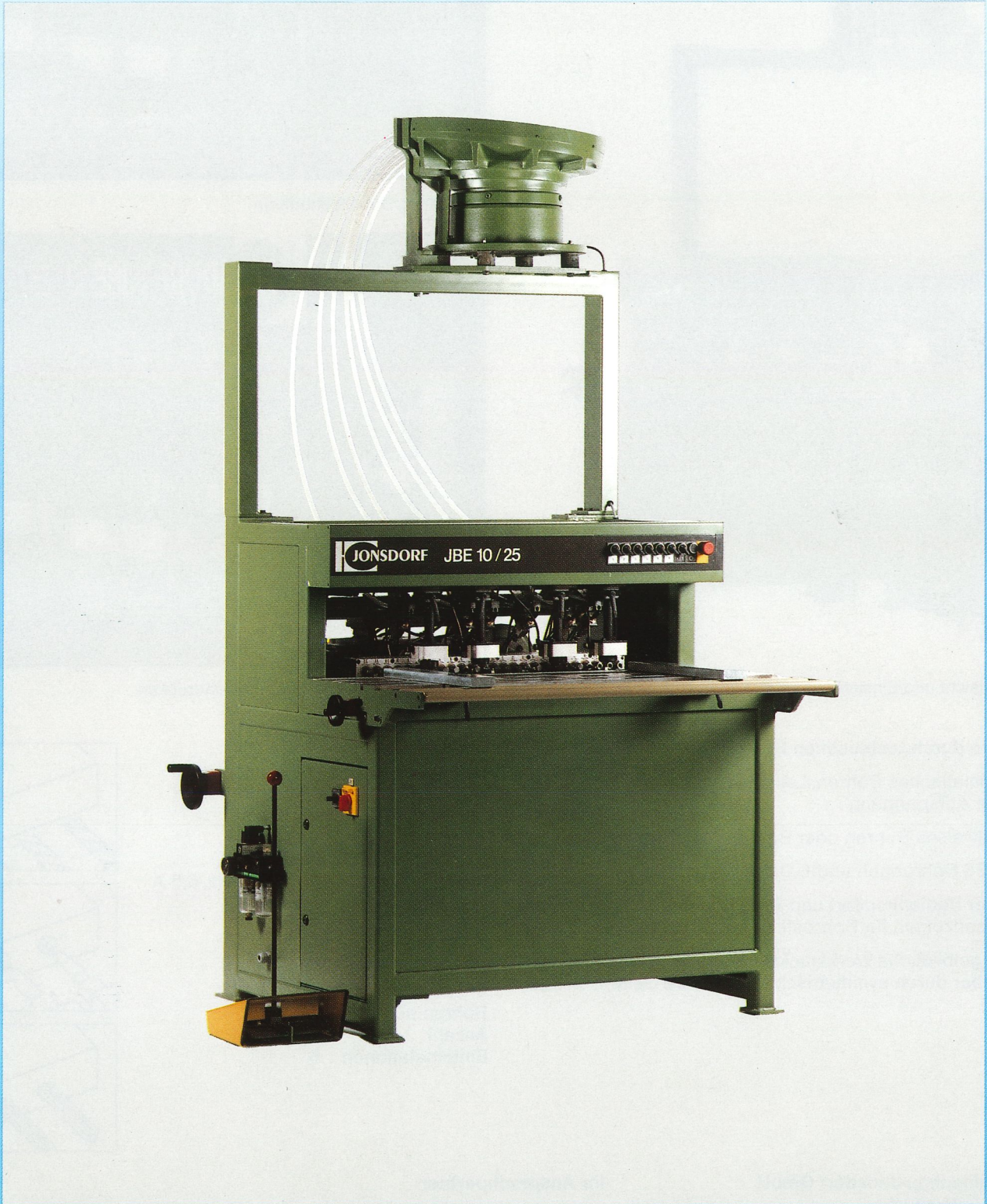
Dübellochbohr- und Eintreibmaschine JBE 10/25