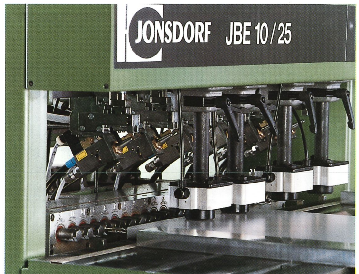
Einstellung Beleimen und Dübeleindrücken