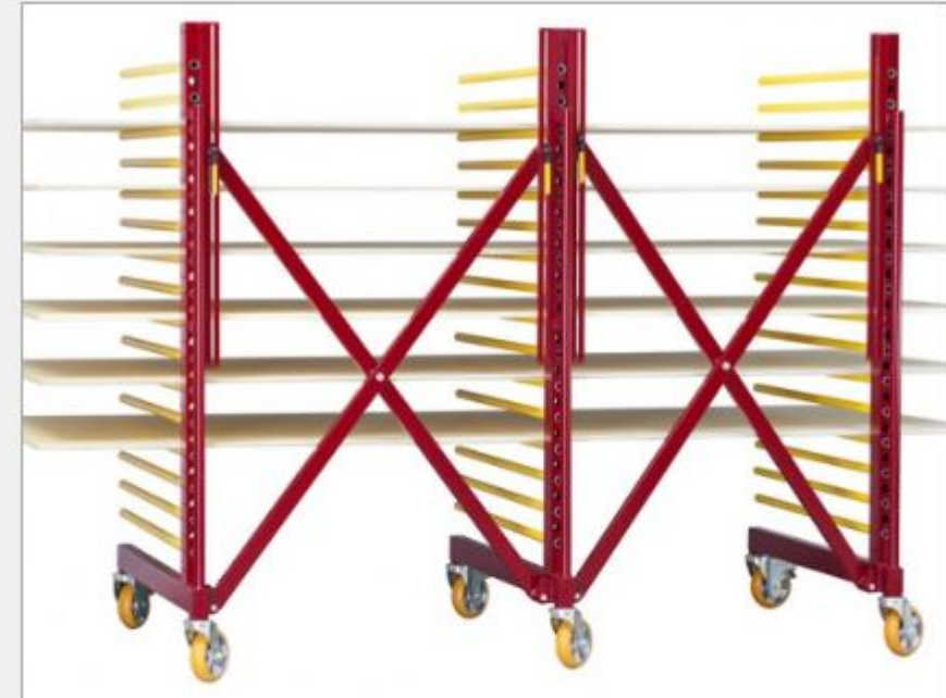
R1100-X3 mit 16 Etagen - "der Tiefgründige"