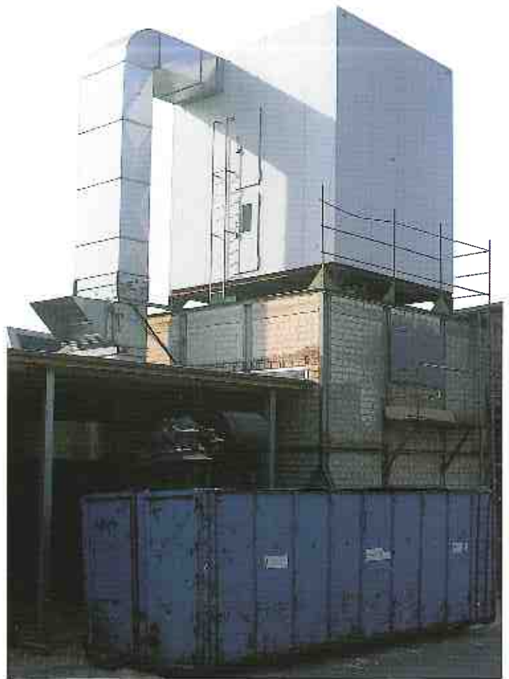
Abbildung zeigt: Nestro Filterhaus mit 80 mm Isolierverkleidung und 633 qm Filterfläche, begehbarem Mittelgang mit Bunker-austragung und Zellenradschleuse für druckfreie Beschickung des Spänebunkers.

mit 80 mm isolierter Wärmeschutzverkleidung, beide Seiten sendziniert verzinktes Stahlblech, in RAL 9010 hochwertig lackiert, besticht durch seine formschöne Ausführung und saubere Verarbeitung. Die Isolierverkleidung sorgt bei der Rückluftführung für geringe Wärmeverluste. Ein weiterer Vorteil ist die schnelle Montage, wobei keine Außenschrauben verwendet werden. Zwei große Einstiegstüren (Einblasraum) und im Filterraum ermöglichen eine gute Begehung und Kontrolle des Filterhauses. 8 bzw. 16 Rüttelmaschinen sorgen für eine intensive Reinigung der Filterschläuche. Steigleiter mit Rückschutz und Podeste mit Geländer gewährleisten die nötige Sicherheit. Untergestelle aus Breitflanschträgern erlauben eine Durchfahrhöhe bis 4,00 m und direkte Beschickung eines Containers mittels Zellenradschleuse und beweglichen Stützen mit Schnellverschluß.