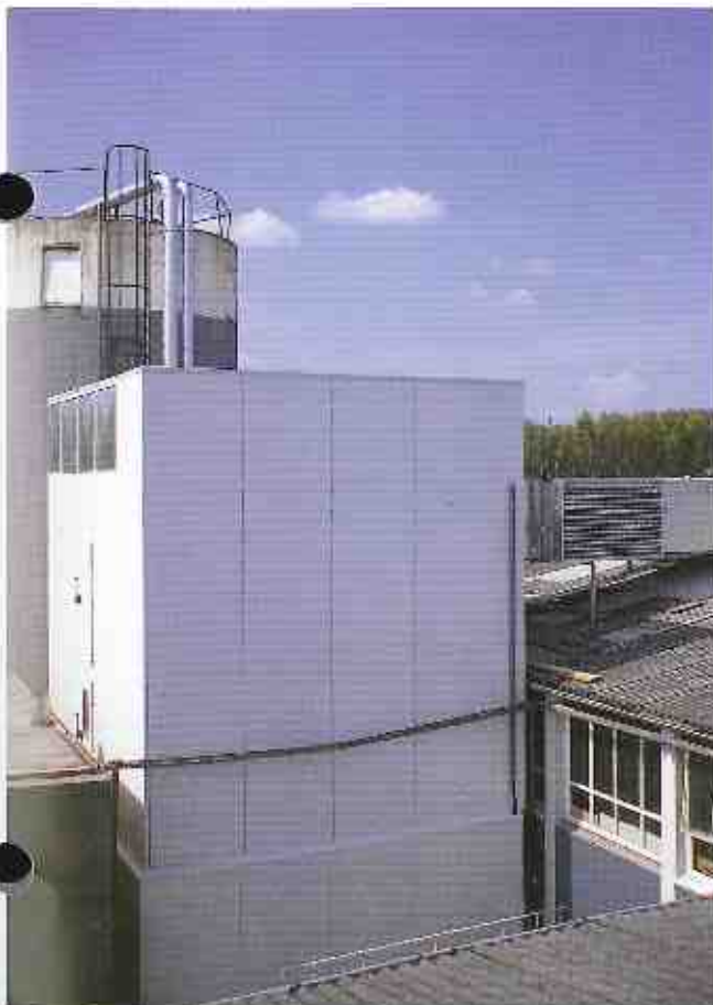
Abbildung zeigt: Nestro-Filterhaus mit Isolierverkleidung und Rückluftkanal mit Isolierung in einem Fensterwerk. Filterfläche 933 qm auf engstem Raum platziert. Zusätzliche untere Verkleidung des Untergestells zur Schalldämmung der Absaugventilatoren, die unter dem Filterhaus aufgestellt werden. Filterhaus-Entleerung mittels Teleskop-Austragräse und Zellenradschleuse. Transportventilator und Ringleitung für druckfreie Beschickung des Spänesilos!