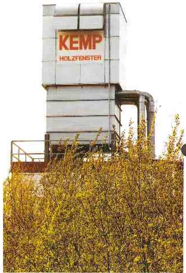
Abbildung zeigt: Filterhaus Type NFHS, mit Zellenradschleuse zur direkten Beschickung vom Spänebunker.