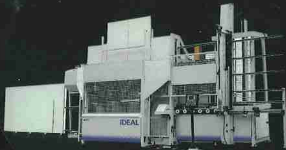
SECCIONADORAS ANGULARES VERTICALES