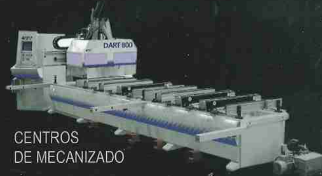
CENTROS DE MECANIZADO