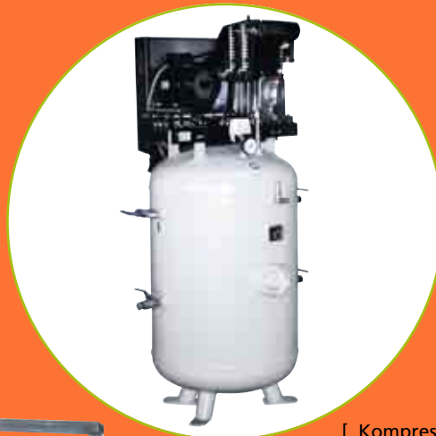
[ Kompressor ]