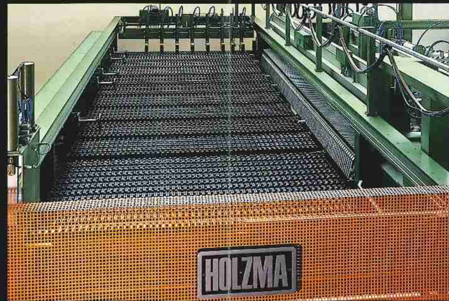
Maschinentisch der Quersäge: HOLZMA Combi-Profil mit Rollen, Querübergabe und geöffnete Abfallklappe Machine table of cross-cut saw: HOLZMA Combi-Profile with rollers, cross transfer for panel books and open flap for automatic waste Mesa de la sierra transversal: HOLZMA Combi-Profil a rodillos, entrega transversal y chapaleta de desecho abierta