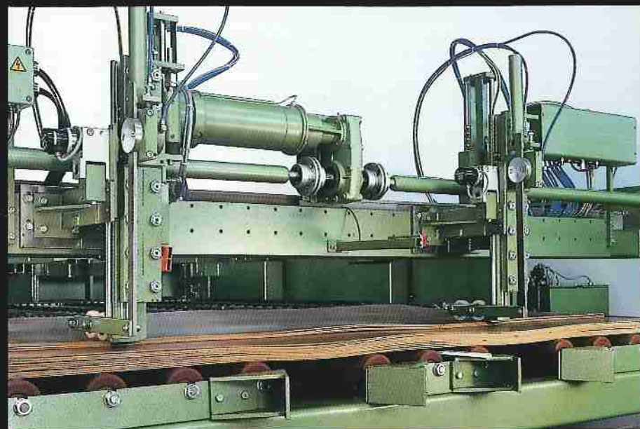
Elektronische Mikroeinschubvorrichtung speziell für dünne, wellige Platten Electronic micro-feed specially for thin, wavy panels Dispositif de micro-alimentation électronique, même pour des panneaux minces ou ondulés Dispositivo de micro-alimentación electrónico, especialmente para tableros delgados y ondulados