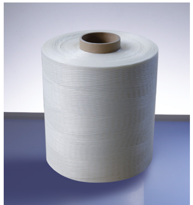
KUPER Breitfaden Typ 7880X für alle Mittellagen-Zusammensetzlinien

Die effektive Arbeitsgeschwindigkeit ist abhängig von mehreren Faktoren, insbesondere der Furnierqualität und der effektiven Streifenbreite!