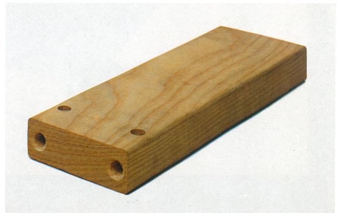
Alcuni esempi di lavorazione con PADE 1000/N Woodden samples worked with PADE 1000/N Pièces en bois usinées avec PADE 1000/N Bearbeitete Holzteile mit Maschine PADE 1000/N