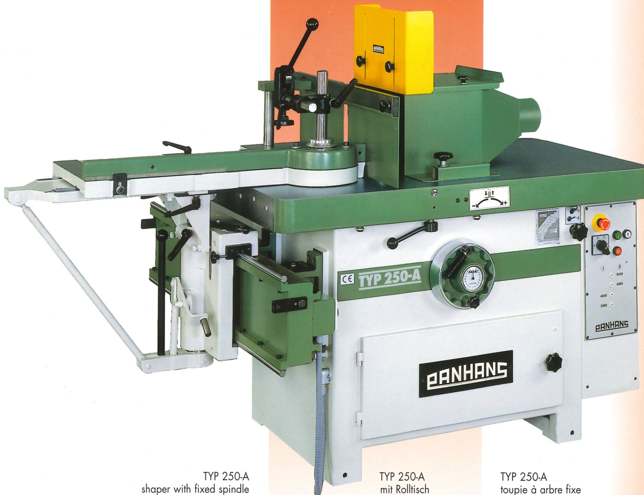
TYP 250-A shaper with fixed spindle and with sliding table