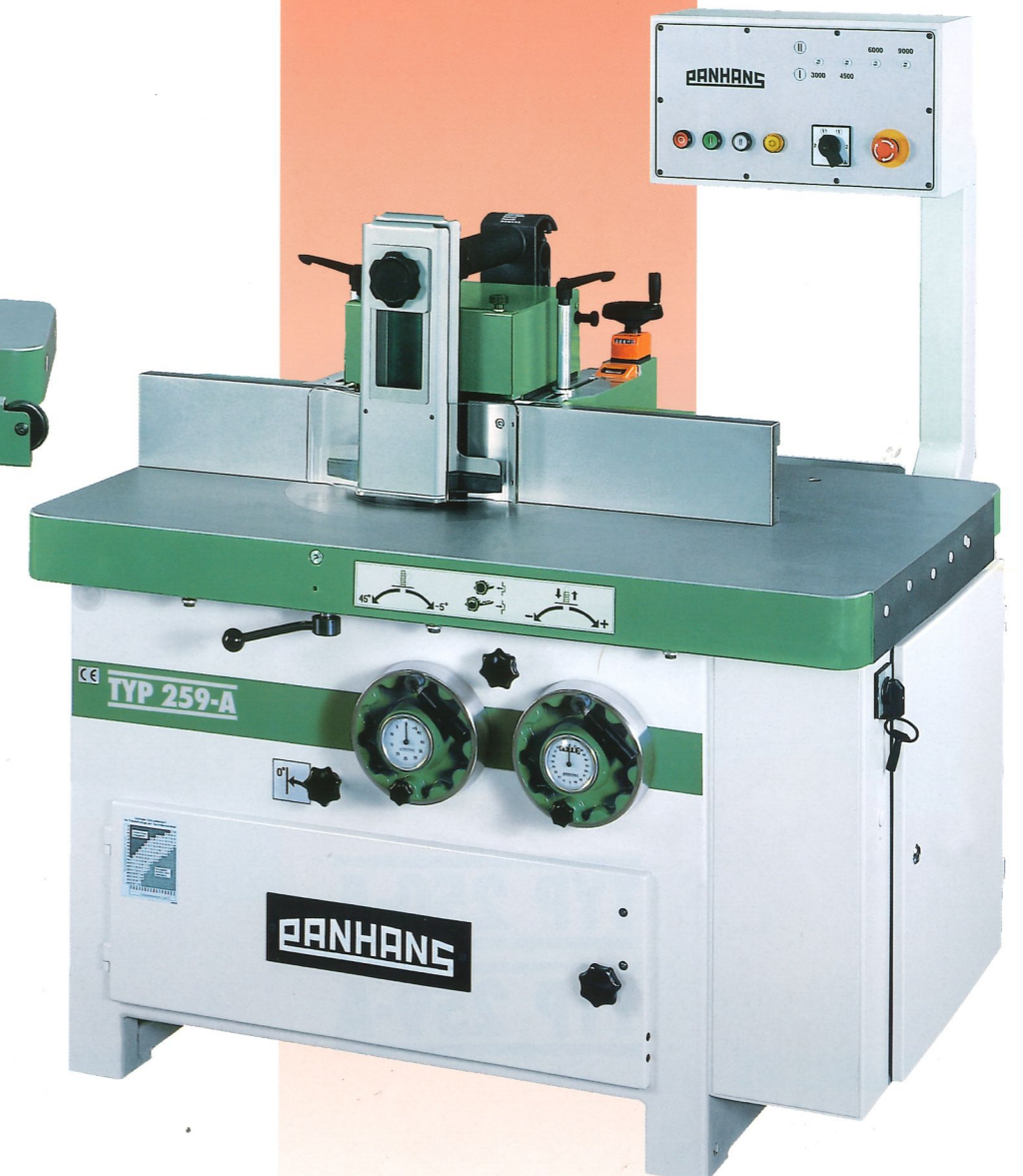
TYP 259-A shaper with tilting spindle and with overhanging switchboard shaper fence TYP 203 Centrex