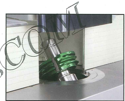
Inclinazione dell'albero toupie 90° - 45° verso l'interno della macchina (F205).