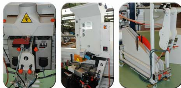
Vista de grupo repasador doble neumático, prefusor de cola y almacén doble rollo.