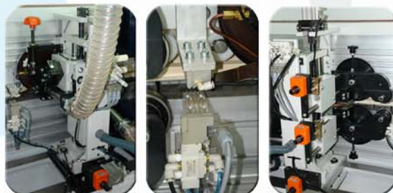
Grupo rascador de radio, sistema pinzado de tiras y rascador plano de limpieza.