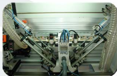
Grupo retestador V12/320. Posicionamiento automático recto/bisel.