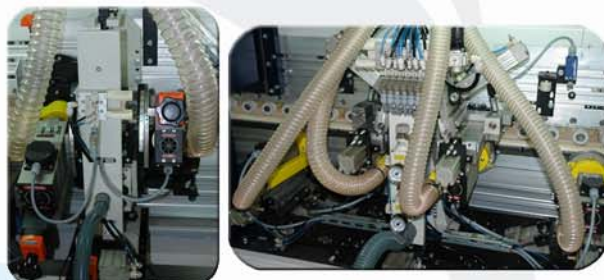
Grupo ribeteador inclinable DA-10 y ribeteador de formas con 4 motores