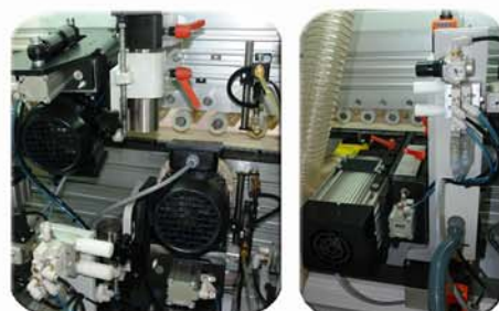
Líquido de limpieza, grupo matacantos oscilante y grupo ranurador neumático.