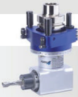
HSK F63 Einfachwinkelkopf zur Aufnahme eines Bohr- oder Fräswerkzeuges mit 1 Ausgang Best.-Nr. 300-24-001