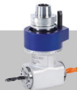
HSK F63 Zweifachwinkelkopf mit 2 Ausgängen WELDON für Bohrwerkzeuge Best.-Nr. 300-24-033