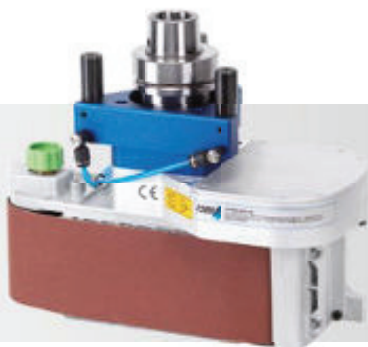
HSK F63 Bandschleifaggregat zum Schleifen von seitlichen Flächen Best.-Nr. 300-24-039