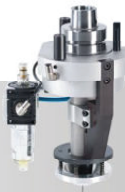
HSK F63 Messeraggregat, pneumatisch, zum Schneiden von weichen Materialien Best.-Nr. 300-24-036