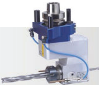
HSK F63 Schlosskastenaggregat mit 1 Ausgang ER 32 für Bohr- oder Fräswerkzeug mit zwei Druckluftausblasdüsen und 1 Ausgang hinten ER 16 für Bohr- oder Fräswerkzeug Best.-Nr. 300-24-017 Best.-Nr. 300-24-038 (H08 2I-3IP)