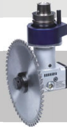
HSK F63 Einfachwinkelkopf zur Aufnahme eines Sägeblattes mit 1 Ausgang (ATLOCK-Verschluss), max. Ø 240 mm Best.-Nr. 300-24-009 max. Ø 300 mm Best.-Nr. 300-24-008