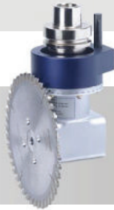
HSK F63 Einfachwinkelkopf zur Aufnahme eines verschraubten Sägeblattes mit einem WELDON Ausgang, max. Ø 180 mm Best.-Nr. 300-24-002 max. Ø 240 mm Best.-Nr. 300-24-003 max. Ø 300 mm Best.-Nr. 300-24-007