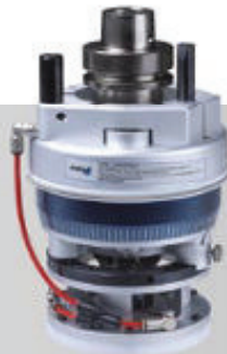
HSK F63 Tastaggregat für vertikales Tasten exakter Frästiefen HSK F63 Best.-Nr. 300-24-034