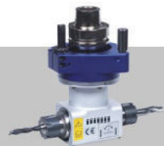
HSK F63 Zweifachwinkelkopf mit 2 Ausgängen ER 25 Bohr- und Fräswerkzeug Best.-Nr. 300-24-011