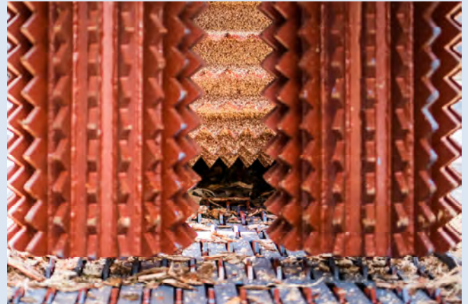
Einzugswalzen aus HARDOX® 400 Feed rollers made of HARDOX® 400 Rodillos de alimentación de HARDOX® 400 Подающие ролики из HARDOX® 400