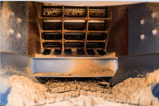
Langlebige Messer und Sicherungsleiste Durable knives and fuse block Cuchillos duraderos y regleta de fusibles Прочные ножи и их безопасная посадка