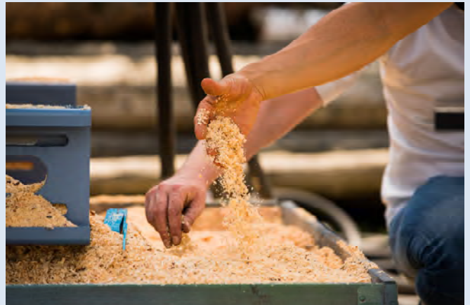
Ausstoß 85% < 2 mm, 95% < 3 mm Output 85% < 2mm, 95% < 3 mm Producción 85% < 2mm, 95% < 3 mm Фракция 85% < 2mm, 95% < 3 mm

Wir behalten uns das Recht vor, technische Änderungen sowie Änderungen von Material und Spezifikationen ohne Ankündigung vorzunehmen. / We reserve the right to make changes in technical aspects, material and specifications without prior notice. / Nos reservamos el derecho de efectuar modificaciones técnicas, materiales e indicaciones sin orden específico. / Мы оставляем за собой право на внесение технических изменений и изменений в спецификации, без предварительного уведомления.