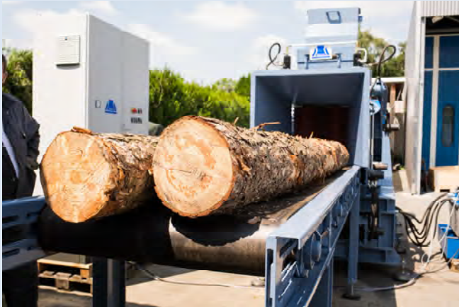
Zuförderband Feeding conveyor belt Cinta transportadora Транспортёр подачи брёвен