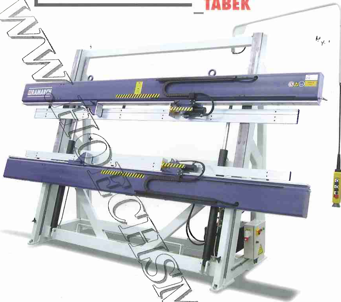
TABEK 3019 Super