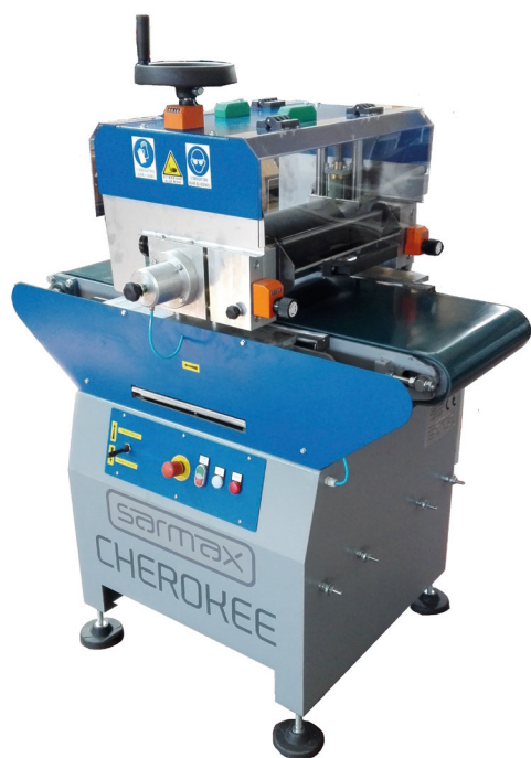
> CHEROKEE OL-VR