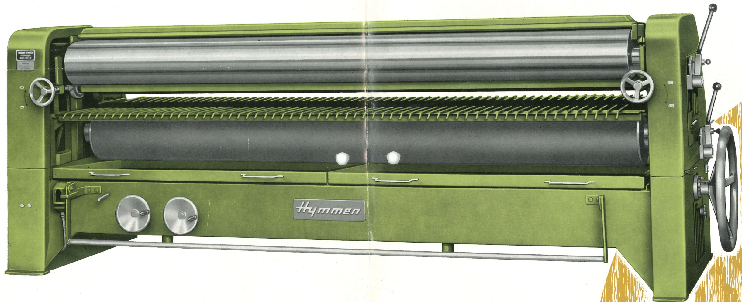
Vier-Walzen-Leimauftragmaschine „Hymmen“ - Type LA 4W 2300