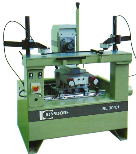
Unter Vorbehalt technischer Veränderungen.

Einfache Ausführung zum Einbringen von Langlochbohrungen bei verschiedenen Holzprofilen mit einer schnellverstellbaren und stufenlosen Bohrhöheneinstellung.