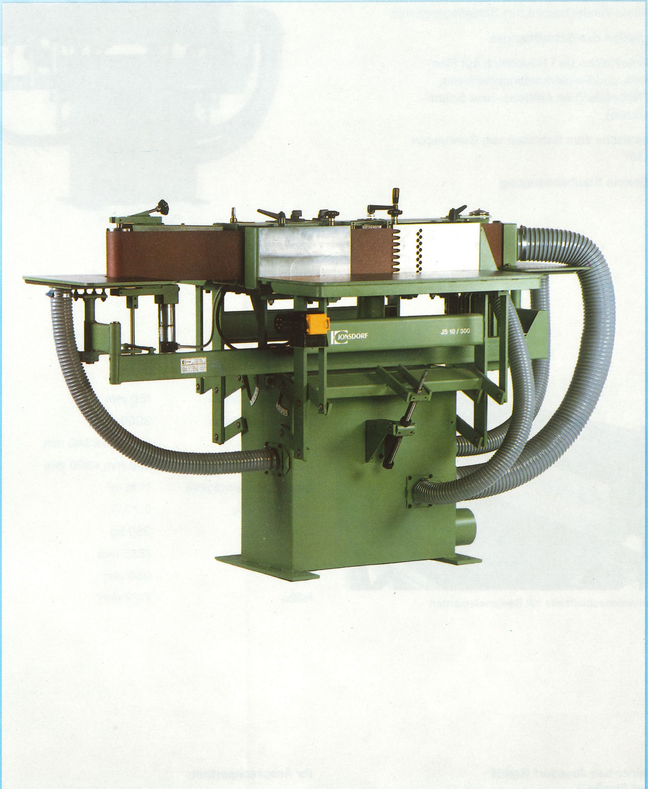
Mehrzweck-Kantenschleifmaschine JS 10/300