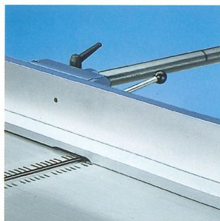
Schwenkbarer Hilfsanschlag zur Bearbeitung kleinerer Werkstücke